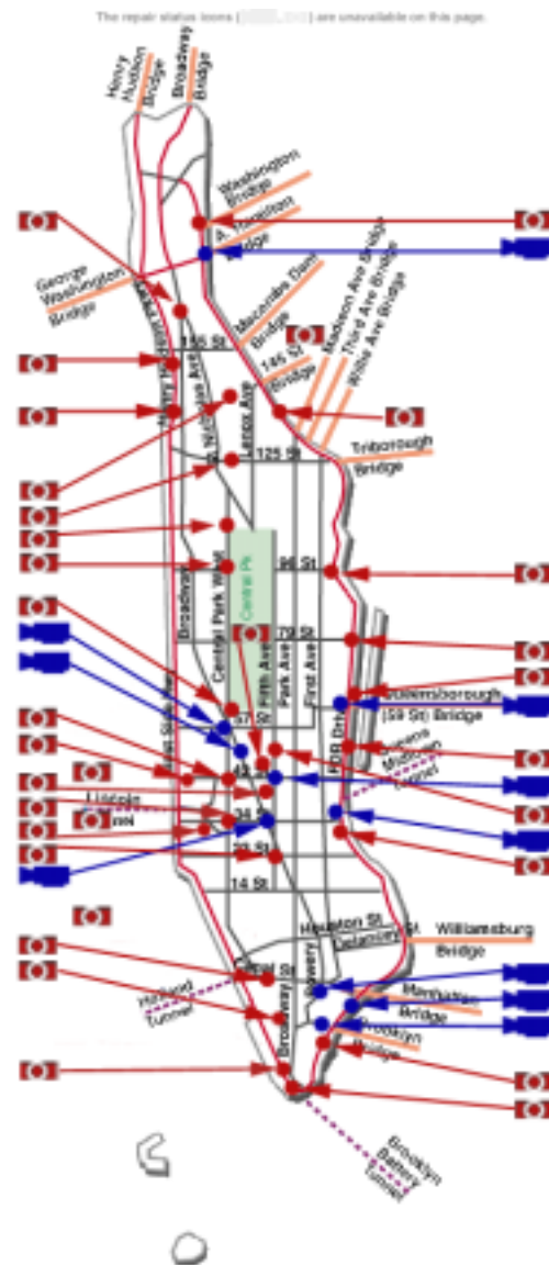
図表 13 マンハッタンにおける交通状況監視カメラの設置状況

る。上述の「Trips123」にしても、そのランニングコストを公的部門がどこまで負担すべきかが議論になっているようであるが、アメリカ人は日本人以上に(?)ケチなので、道路交通情報提供の対価負担を受益者である利用者に求めるビジネスモデルが米国で成立するとは思えない。だからといって公的部門が丸抱えで行うことに対しては、やはり批判的な声もあり、あり得べきモデルを求めて模索が続いているというのが実態ではなからうか。