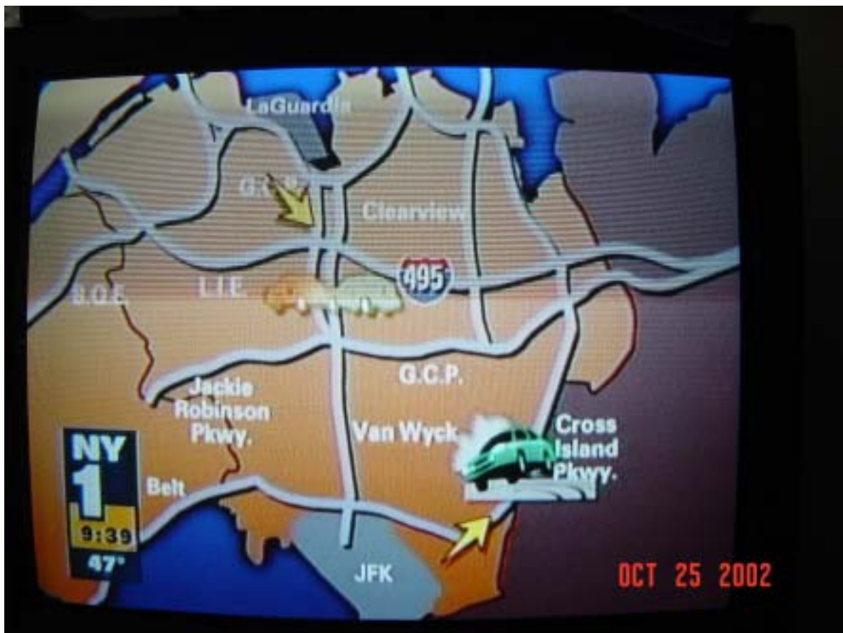
図表 12 地元ケーブルテレビ局での道路交通情報

するニーズは高いと思われる。しかし、意外にもニューヨークでは、ラジオ等での通常の放送はあるものの、東京の感覚で考えて「まともな」道路交通情報提供サービスは無いと言って良いであろう。(驚くべきことに、地元ケーブルテレビ局「NY1」( http://www.ny1.com/ )で毎朝放送されている道路交通情報でさえも、具体的な渋滞状況はまったくわからずお寒い限りであると言わざるを得ない。)